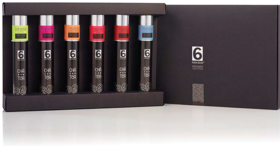
PACK'6 – EXPERIÊNCIAS DE CHÁS AROMÁTICOS N. 1 PACK'6 – AROMATICS TEA EXPERIENCES N. 1

Chá verde com citrinos | Chás pretos com frutos vermelhos, orquídeas e especiarias | Chá verde com menta e rosas | Chás verdes com frutos vermelhos e citrinos | Rooibos com pedaços de chocolate, amêndoa e hortelã-pimenta | Mistura de chás com frutos do bosque e pétalas de centáurea.