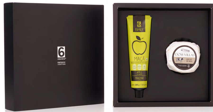
BOX GASTRONÓMICA N. 2 – Queijo de Vaca + Doce de Maça GASTRONOMIC BOX N. 2 – Cow Cheese + Apple Jam

Doce de Abóbora e Laranja com Canela e Amêndoa - 200g | Queijo de Vaca - 190g Pumpkin and Orange Jam with Cinnamon and Almond - 200g | Cow Cheese - 190g