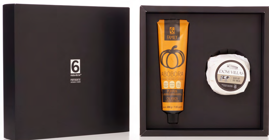
BOX GASTRONÓMICA N. 1 – Queijo de Vaca + Doce de Abóbora GASTRONOMIC BOX N. 1 – Cow Cheese + Pumpkin Jam

Doce de Abóbora e Laranja com Canela e Amêndoa - 200g | Queijo de Vaca - 190g Pumpkin and Orange Jam with Cinnamon and Almond - 200g | Cow Cheese - 190g