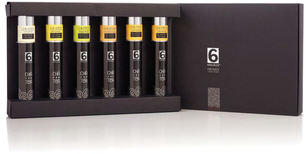
PACK'6 – EXPERIÊNCIAS DE CHÁS AROMÁTICOS N. 2 PACK'6 – AROMATICS TEA EXPERIENCES N. 2

Chá Verde com Jasmim | Chá Verde com Ananás | Chá Preto com Maça Verde | Chá Oolong com Flor de Laranjeira | Chá Preto com Maracujá | Chá Preto com Pêssego.