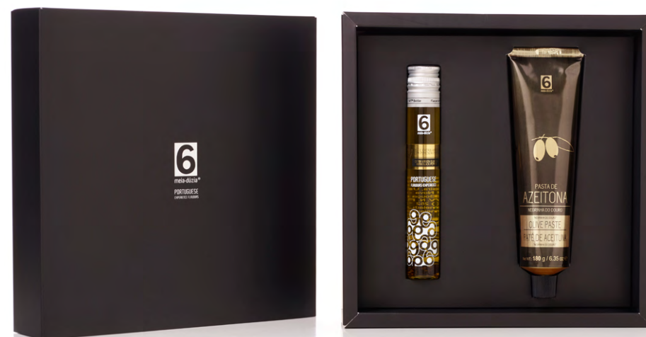
BOX GASTRONÓMICA N. 9 – Pasta Azeitona Negrinha do Douro + Azeite GASTRONOMIC BOX N. 9 – Olive Paste “Negrinha do Douro” + Olive Oil

Black Gift Box | Olive Paste “Galega” with Fig - 180g | Extra Virgin Olive Oil with Green Pepper – 60ml.