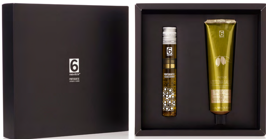
BOX GASTRONÓMICA N. 8 – Pasta Azeitona Galega com Figo + Azeite GASTRONOMIC BOX N. 8 – Olive Paste “Galega” with Fig + Olive Oil

Box Oferta Preta : Pasta de Azeitona Galega com Figo - 180g + Azeite Extra Virgem com Pimenta Verde – 60ml.